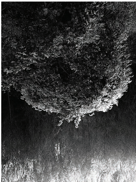
Êtres 2019-2020 – Projet en cours