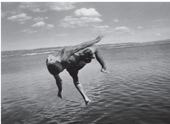
La petite mer des oubliés 2006

Avec Constellations , sa création à partir de l'Odyssée d'Homère, il élabore une nouvelle géographie méditerranéenne, dans laquelle les récits photographiques viennent tisser une histoire collective à partir des destins de chacun. Les paysages et les corps saisis par Franck Pourcel sont les témoins inflexibles de la richesse des altérités.