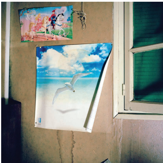
HLM du stade 2012-2014