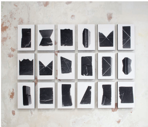
Black bloc #1 à 20 2020

Gilles Pourtier a une conception ouverte de la photographie. Refusant de contraindre une pratique qui s'appuie sur des situations de résidences, d'expositions, d'éditions spécifiques ou de collaborations, il se plaît à tordre les formats pour produire des œuvres qui sont autant des images que des objets ou des installations. Aussi chaque projet est-il l'origine d'une nouvelle mise en recherche formelle. La collaboration est souvent au cœur de sa production, comme un espace de négociation qui permet à chacun de porter plus avant sa pratique, elle donne parfois lieu à des œuvres dans lesquelles la signature partagée indifférencie les photographies prises par l'un ou par l'autre. Mais qu'il remonte une rivière avec Anne-Claire Broc'h ( Before science ), qu'il parte à la rencontre de granges en train de s'affaisser avec Sandro Della Noche et Guillaume Gattier ( They shoot horses, they don't demolish barns ), ou qu'il s'intéresse à la vie ouvrière en Slovaquie ( Vztahy ) Gilles Pourtier signe son travail d'un regard précis, empreint d'une forme d'humilité et de poésie.