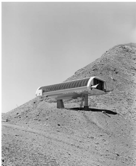
Vall Fosca 2015

Depuis de nombreuses années, Jürgen Nefzger porte une attention particulière aux symptômes de l'effondrement du monde, aux armes de démantèlement de la vie et aux forces de résistances. Ses photographies comme ses films sont les révélateurs d'un inquiétant mouvement de transformation environnementale. Plus que des témoignages, ses œuvres sont portées par la précision du regard qui accompagne leur engagement critique. Elles donnent à voir l'impact d'un modèle politique construit sur l'économie et la consommation. Photographe des paysages contemporains marqués par l'activité industrielle, Jürgen Nefzger capte la mutation en cours. Des cheminées jumelles de centrales nucléaires, aux zones pavillonnaires à l'architecture modélisée, en passant par ce qui perdure, pour quelques temps encore, des glaciers, ses photographies saisissent avec acuité cette invraisemblable accélération qui dessine d'obscures perspectives.